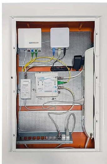
Esempio di allestimento